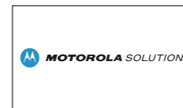
01 Motorola Solutions