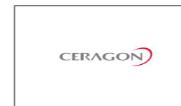
02 Ceragon Networks