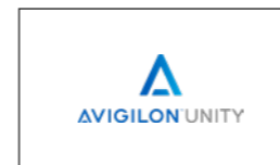
01 Avigilon Unity